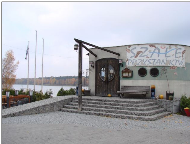
Fot. 7. Przystań i lokal gastronomiczny KTW „Szale”.

W okresie letnim na zbiorniku kursuje statek spacerowy „OPATÓWEK” zatrzymujący się na przystani przy lokalu gastronomicznym KTW.