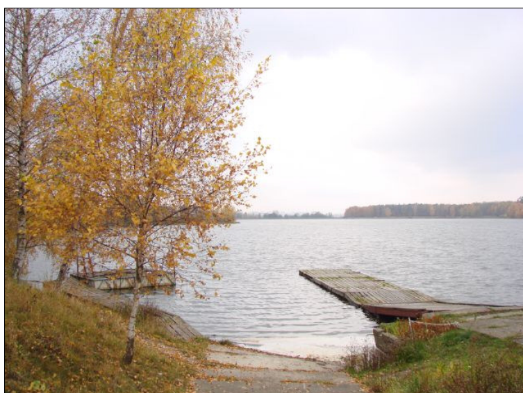
Fot. 6. Przystań nad zalewem „Szale”.

Tereny rekreacyjne z plażą piaszczystą i trawiastą oraz polem namiotowym użytkowane są przez Sezonowy Ośrodek Rekreacyjno – Wypoczynkowy w Kaliszu. Ośrodek ma powierzchnię 10 ha i usytuowany jest w odległości 7 km od centrum miasta Kalisza. Na terenie Ośrodka znajduje się również boisko plażowej piłki siatkowej, stała zadaszona estrada, utwardzony krąg taneczny. Istnieje możliwość organizacji festynów, zawodów, regat kajakowych i wioślarskich, zlotów, obozów, imprez estradowych, okolicznościowych, a zimą - uprawiania łyżwiarstwa. Do Ośrodka można dojechać autobusami komunikacji miejskiej Kalisza..