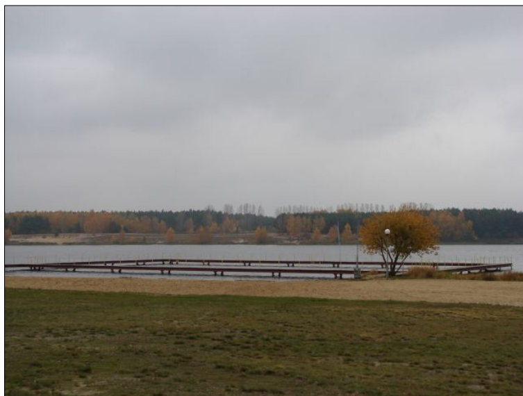
Fot. 4. Zbiornik retencyjny „Szale” - pomost.