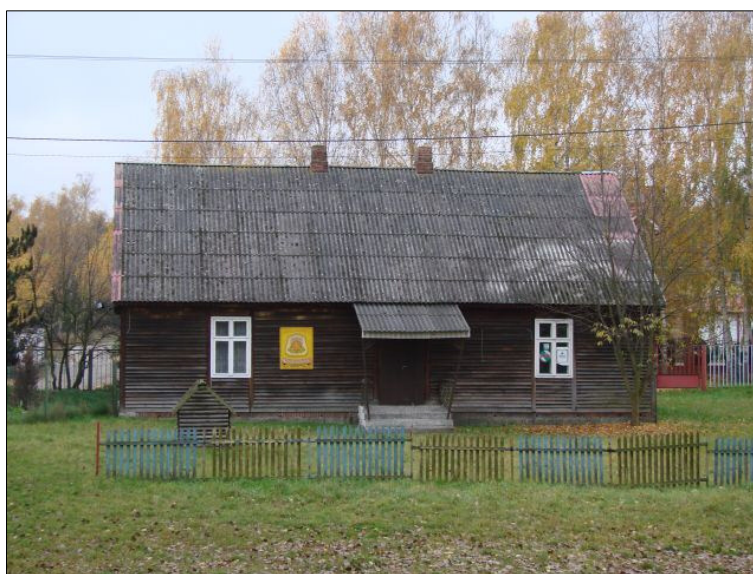
Fot. 9. Zabudowa wiejska Szale.

przeprowadzono analizę wyposażenia w usługi i zainwestowanie gospodarcze, obsługę ludności poszczególnych wsi i określono funkcje jednostek osadniczych. W oparciu o te dane, w miejscowości Szale, jako podstawowe funkcje dla przestrzeni społeczno – gospodarczej wyznaczono: mieszkalnictwo, turystyka i rekreacja.