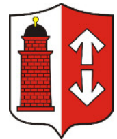
Wójt Gminy Opatówek