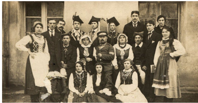
Kółko Teatru Amatorskiego w Opatówku - 1917 rok