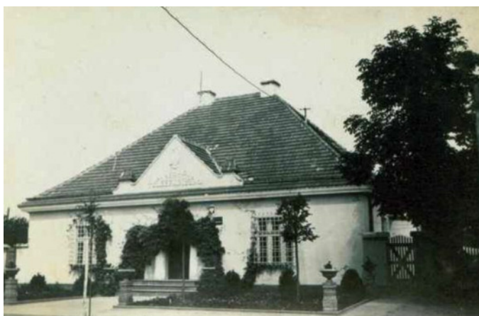
Pierwszy nowy budynek poczty w niepodległej Polsce - Opatówek