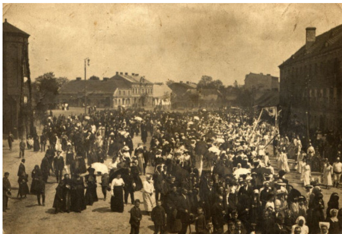
Boże Ciało w Opatówku