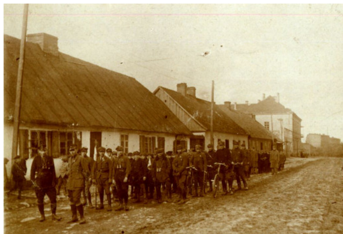
Ochotnicy - 1918 rok