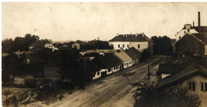
Opatówek, ul. Kościelna